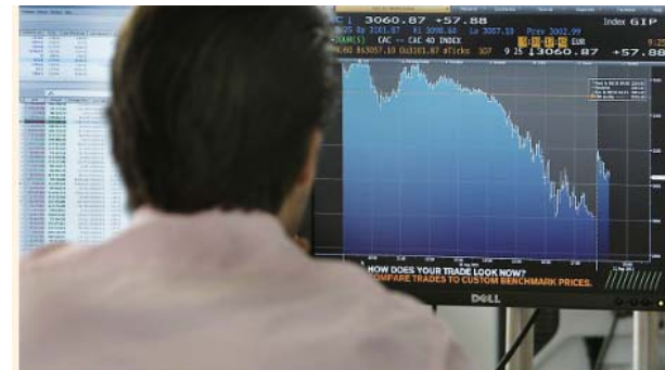
FLOMMER UT: Kundene strømmer nå ut av DnB Nor aksjefond, etter at en rekke fond stuper i verdi.